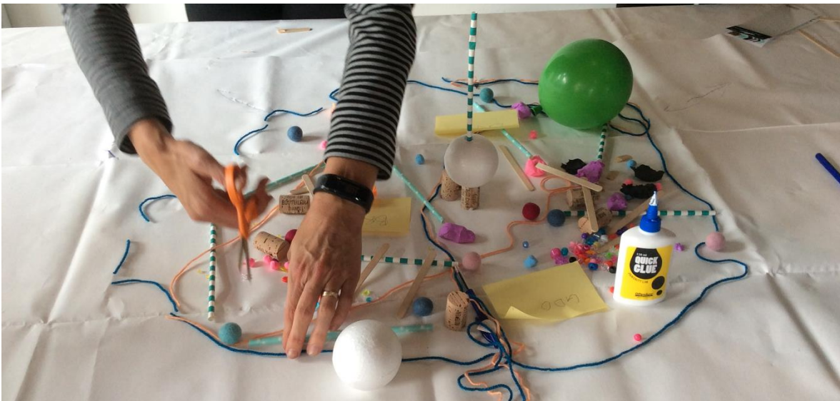
Afbeelding 5: Toekomstig systeem (groep 3)