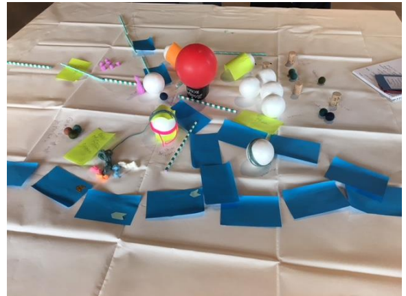
Afbeelding 6: Huidig systeem (groep 4)