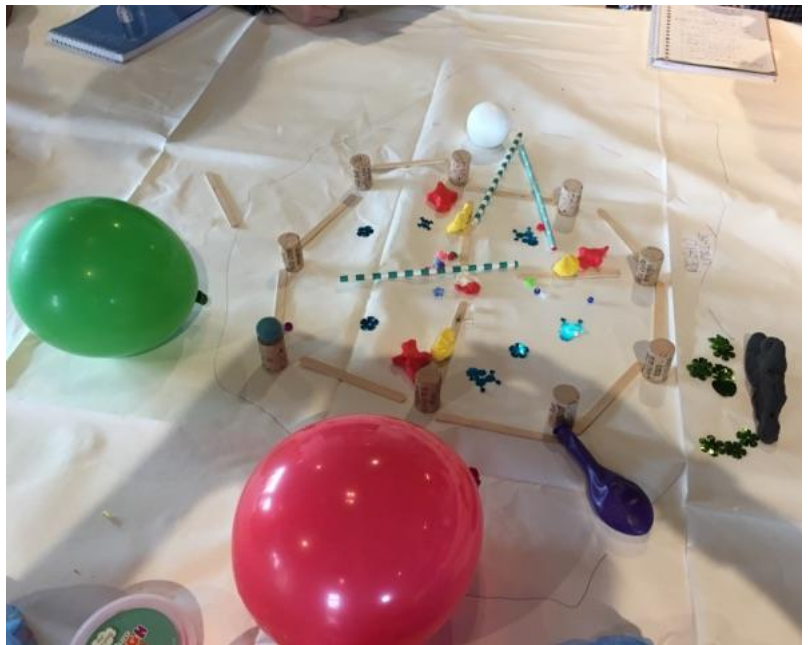
Afbeelding 1: Huidig systeem (groep 1)