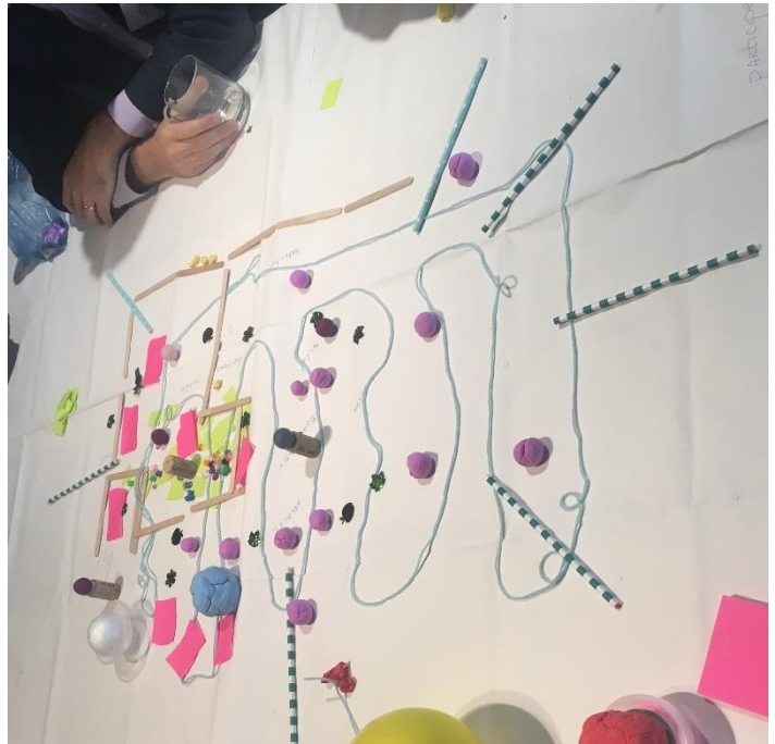
Afbeelding 3: Toekomstig systeem (groep 2)