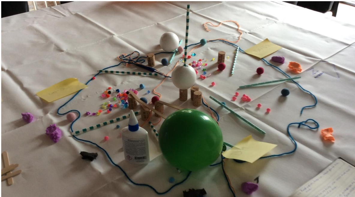
Afbeelding 4: Huidig systeem (groep 3)