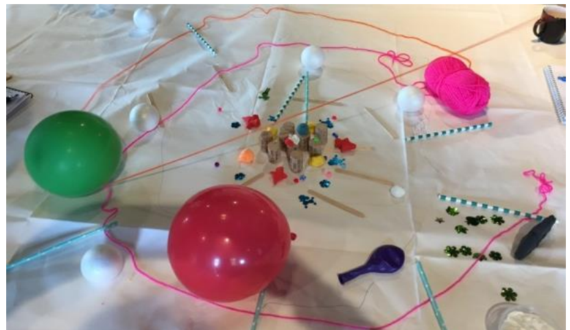
Afbeelding 2: Toekomstig systeem (groep 1)